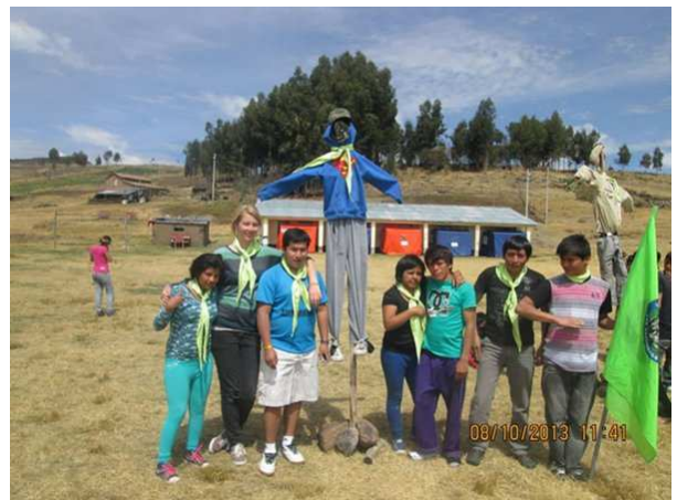
Competitie met vogelverschrikkers