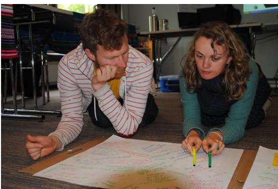
Deelnemers van de Young Talents on Tour

Een dag meedenken en brainstormen is altijd leuk, maar 't is helemaal leuk als je ondertussen ook nog wat leert. Vandaar dat Los Cachorros een goede organisatie was om bij aan tafel te zitten omdat er genoeg te leren viel over de problematiek rondom straatkinderen in Peru. Daarnaast