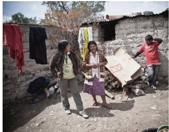
Alanya op huisbezoek

Het is nodig dat twee meisjes uit huis geplaatst worden, omdat ze blootgesteld worden aan mishandeling en verkrachtingen. Een van de meisjes is inmiddels opgevangen in de 24 uren opvang. Bij het andere meisje ligt het wat gecompliceerder aangezien de oudere broer het er niet mee eens is.