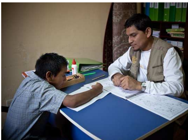
Psycholoog aan het werk

sen gedrag. Hij kan niet goed mee komen in de groep en hij heeft een afwijkend gedrag tegenover vrouwen. Een van de LC teamleden is met hem naar een neuropsycholoog geweest. Er werd geen duidelijke diagnose gesteld. Er werd alleen gezegd dat hij "slecht" geboren is. Dat komt nogal hard over maar volgens de LC psycholoog betekent dit dat het kind geen liefde heeft ervaren tijdens de zwangerschap. Verder werd aangeraden hem vooral niet teveel vertrouwen te geven, duidelijk regels aan te geven en niet over je heen te laten lopen en zondig hem te straffen met de zweep. Ongelooflijk! De neuropsycholoog schreef een medicijn voor waardoor Eduardo wat rustiger zou worden. Een medicijn waar hij alleen maar afhankelijk van wordt. Er wordt naar mogelijkheden gekeken voor een second opinion.