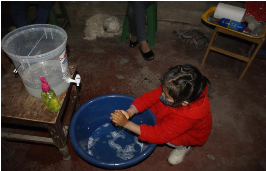
Een meisje uit een achterstandswijk wast haar handen met de sanitaire hulpmiddelen van Los Cachorros.

In achterstandswijken Yamana, Vista Alegre, Mollepata en Belen is geen drinkwater. Deze wijken worden bevoorrad door waterreservoirs. De sanitaire maatregelen vragen om onze handen te wassen, maar dit is onmogelijk voor de bevolking van deze achterstandswijken, omdat ze niet dagelijks de toegang hebben tot water. De meesten zijn daardoor besmet geraakt met Covid-19.