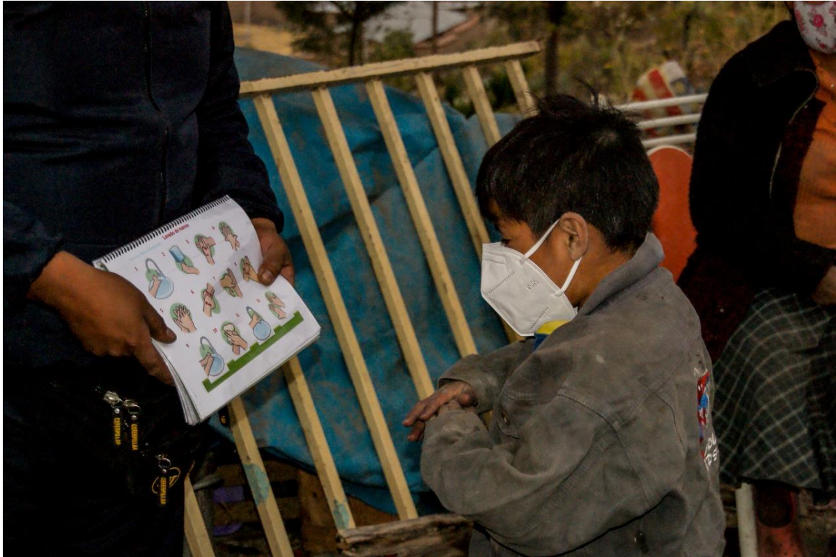
Een jongen krijgt van een van de straatwerkers instructies hoe handen te wassen.

In de eerste drie maanden konden beide straatwerkers nog hun reguliere werk doen: bouwen aan een vertrouwensband met de kinderen, hen stimuleren hen om mee te doen aan de activiteiten op straat en naar de nachtopvang te komen. Samen sporten is een goede manier om met de kinderen in contact te komen en te blijven. In die periode zijn er wekelijks sportactiviteiten geweest, waarin zwemmen, voetbal en basketbal favoriet zijn.